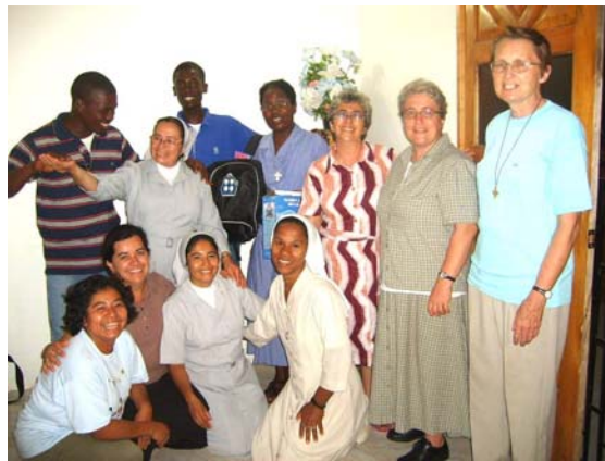
Equipo de la CONDOR

post-trauma... todos eran gestos sencillos de acompañamiento, una mirada, una palabra, un estar con el otro, un caminar juntos, escuchar, guardar silencio ante el dolor o la pobreza del otro, dar un medicamento, preparar comida para dar al otro, abrir